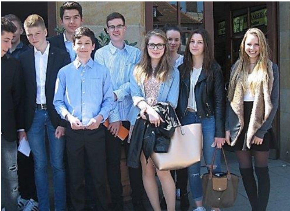
Das Ovid-Dream-Team 2 (Schülerinnen und Schüler der Klasse 9b und 9c)