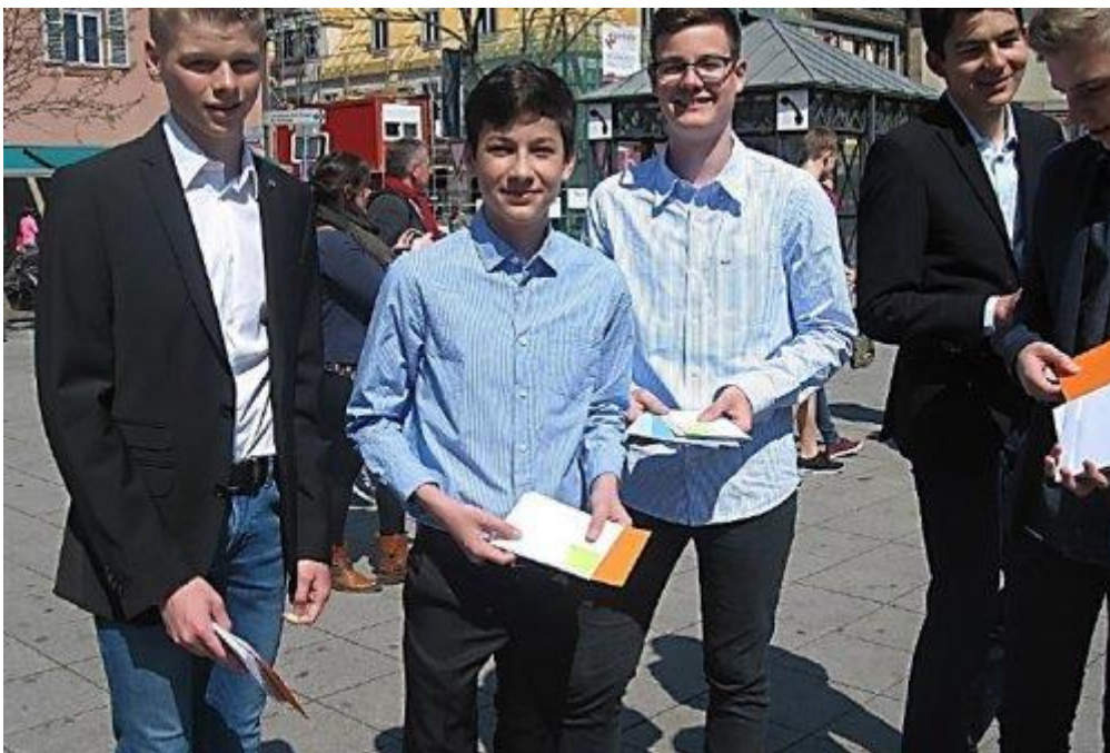
Schüler der Klasse 9b und 9c ... die Briefe warten auf ihre Empfänger

Das Team ist aufgehübscht. Denn man will ja Eindruck machen. Und so wird es am 24. April 2015 Nettigkeiten und Komplimente regnen, die das Team in Form von Briefen oder mündlichen Komplimenten an Unbekannte verteilt.