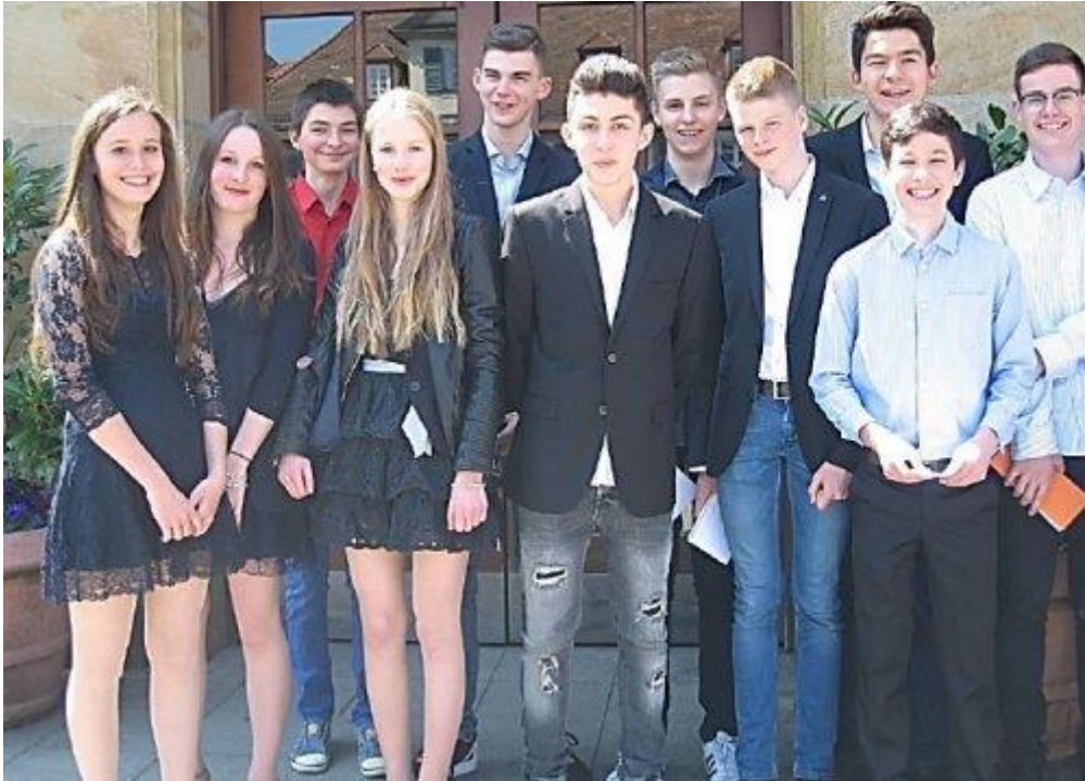
Das Ovid-Dream-Team 1 (Schülerinnen und Schüler der Klasse 9b und 9c)